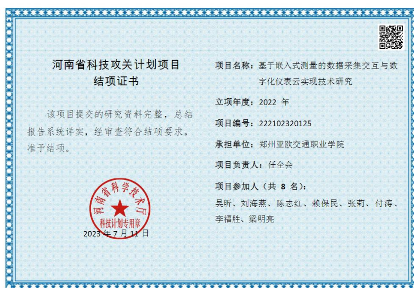
图 3 基于嵌入式测量的数据采集交互与数字化仪表云实现技术研究项目结项

学校立足本位，以科研项目申报为抓手，积极开展科技创新，提升科技服务能力，助力地方经济发展。2023年，学校获评省级课程4门、教师教学能力大赛获省级二等奖5项、三等奖4项。立项省级项目3项。教师在技能大赛中荣获二等奖1项、三等奖1项，科研服务水平稳步提升。